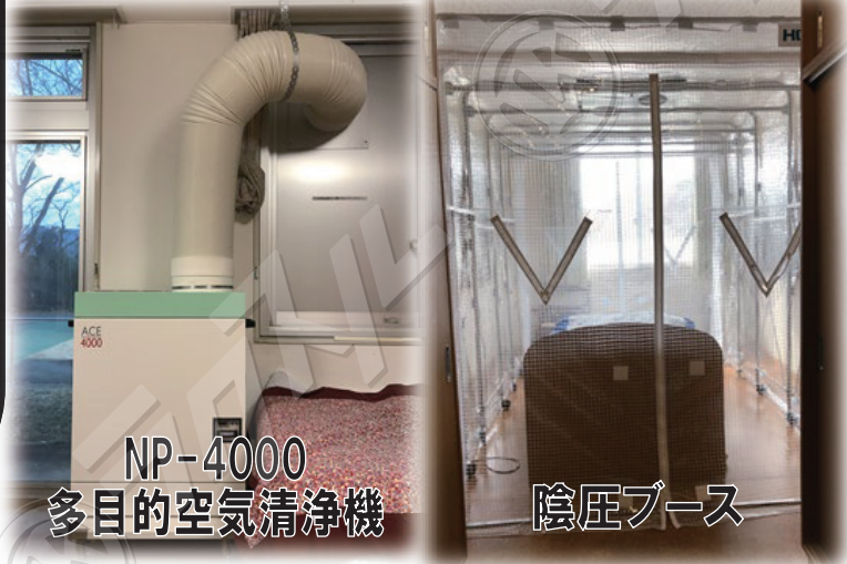
NP-4000 多目的空気清浄機