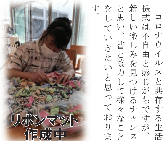
リボンマット作成中

新型コロナウイルスの影響により、感染症対策等で班活動が思うように行えていない現状があります。ですが、園芸班の活動としては今年も変わらずシクラメンの栽培を行っていきます。6月に岐阜県中津川市にあります泉農園さんへシクラメンの苗を受け取りに行きました。