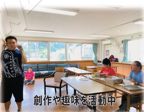
創作や趣味を活動中

さて、こでまりの活動状況ですが、散歩につきましては、あまり大人数にならない形での歩行を継続しています。猛暑の時間帯を避け、朝露が残る時間、日中の日差しが一段落ついた夕刻の時間、穏やかな風を感じられる時間など、熱中症に気を付けた対応を行っております。今夏も、昨年に劣らずの猛暑の日が多く、室内に居て