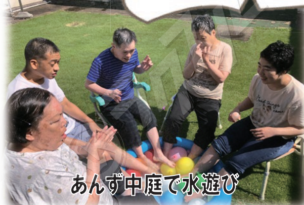
あんず中庭で水遊び