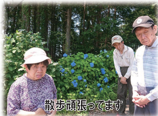
散歩頑張ってます