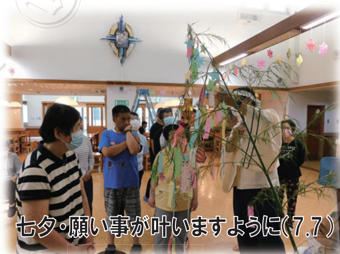
七夕・願い事が叶いますように(7.7)