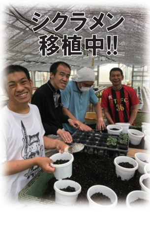
シクラメン移植中!!

新型コロナウイルスの影響により、感染症対策等で班活動が思うように行えていない現状があります。ですが、園芸班の活動としては今年も変わらずシクラメンの栽培を行っていきます。6月に岐阜県中津川市にあります泉農園さんへシクラメンの苗を受け取りに行きました。