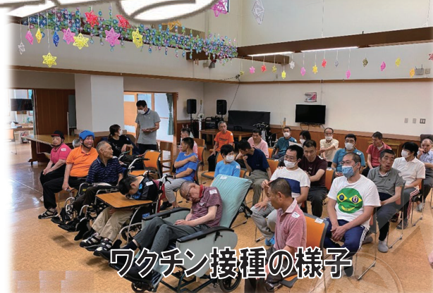
ワクチン接種の様子