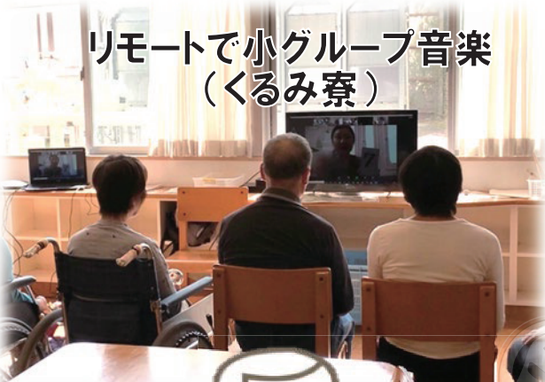
リモートで小グループ音楽 (くるみ寮)