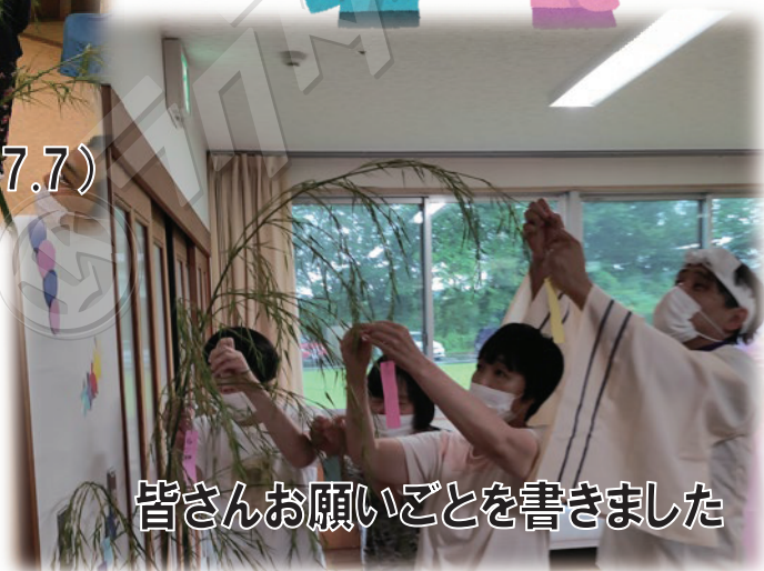
皆さんお願いごとを書きました