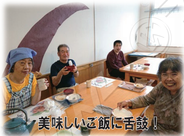
美味しいご飯に舌鼓!

晴れば暑く、コロナ禍ならずとも体調の崩れには注意していかねばならない季節であり、利用者のみならず職員自身の健康を保つていかなければならないと考えて業務にあたっていききたいと思っています。