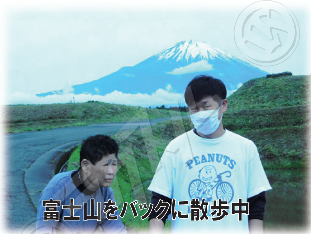
富士山をバックに散歩中

児童の経験が長かったので、成人の方と接した経験は少ないですが、新たな気持ちで一から学んでいきたいと思っています。これからの日々を利用者様も私自身も楽しく過ごす事を心がけていきたいと思っています。