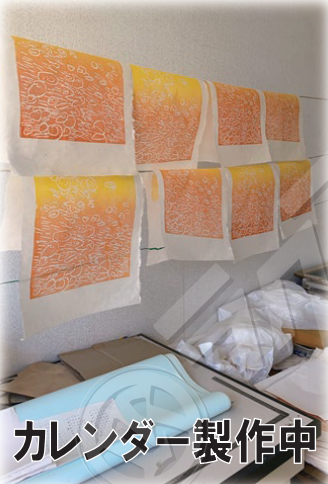
カレンダー製作中

このみると皆さんの元に届くのは葉月から長月にかけて。木々の葉が落ちるようになり夜も少しずつ長くなるそんな季節。毎年何か一つ新しいことをしている学園カレンダー。今年は和風月名を入れてみようかな、と思っっています。少しの違いですが皆さんはどうお感じになるでしょうか?